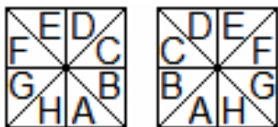
Рис. Секторы РОП

Цель и задачи: операционализация и проверка сформулированных гипотез, в частности сопоставительное исследование показателей хронотопа РОП, стресса, ПФД, клинических характеристик симптоматических ремиссий (СР; F33.4) и эффективности антидепрессивной психотерапии у пациенток после лёгкого или умеренной тяжести эпизода НРДР.